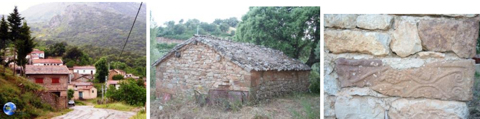
Des Taalba à Alma – Ifri (Vallée de la Soummam). Des pierres de l'époque antique ont servi pour la construction de certaines maisons anciennes