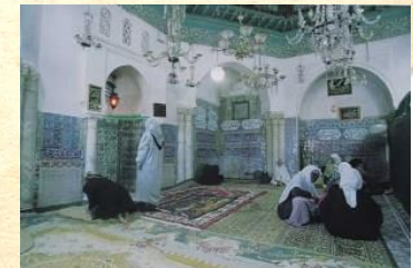
La Médersa Sidi Abderrahmane ath-Tha`aliby à Alger

Renseignements : Professeur Djamil Aïssani Association Gehimab – Unité de Recherche LaMOS, Université de Béjaïa, Targa Ouzemour, 06 000 (Algérie) Téléphone : (213) 34 81 37 08 Tél/Fax : (213) 34 81 37 09 E-mail : lamos_bejaia@hotmail.com http://www.gehimab.org